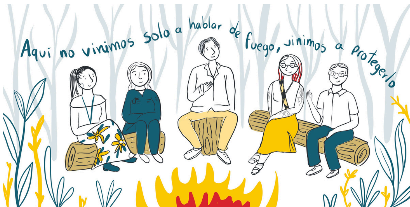
Ilustração: Fernanda Barral/consultora GIZ

A iniciativa da RAMIF reúne experiências para promover a troca de conhecimento em uma reunião presencial na Colômbia, culminando na assinatura de acordos concretos de cooperação.