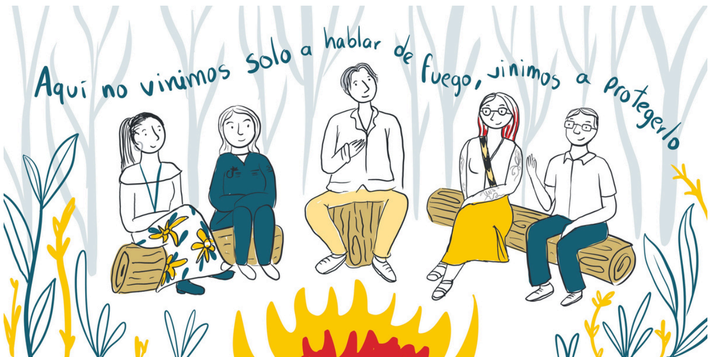
Ilustración: Fernanda Barral/consultora GIZ

Iniciativa en el ámbito de la RAMIF reúne experiencias para promover el intercambio de conocimientos en un encuentro presencial en Colombia, culminando con la firma de acuerdos concretos de cooperación.